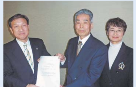
廃棄物減量等推進審議会 から市長へ答申