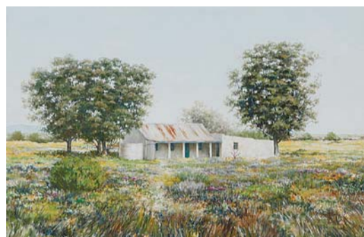
グラーフ川沿いの農家

障がい者の自立支援につなげるために、手の自由を失った世界各国の画家たちが口や足に筆を取り、描いた絵画80点を展示します。画家の創作実演もご覧いただけます。 とき 5月16日(金)～18日(日) 午前10時～午後4時 ところ 三菱電機ビルテクノサービス・教育センター内体育館 費用 無料 後援 小平市教育委員会、小平市社会福祉協議会、小平市 問合せ 三菱電機ビルテクノサービス(株) 人材開発センター ☎042(341)4511