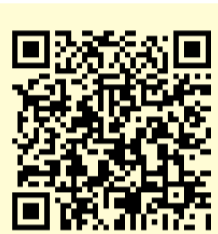
光化学スモッグ注意報等メール送信QRコード

光化学スモッグは、光化学オキシダントという有害物質が、空气中に雲のように漂う現象です。これから9月にかけて光化学スモッグが発生しやすくなり、この濃度