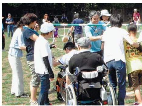
運動会の一コマ (パン食い競走)

体験コーナーを設け、競技するだけでなく、どなたでも気軽に楽しめる内容です。ぜひ、ご参加ください。 とき 5月24日(土) 午前10時から ※雨天の場合は25日(日)に順延、から