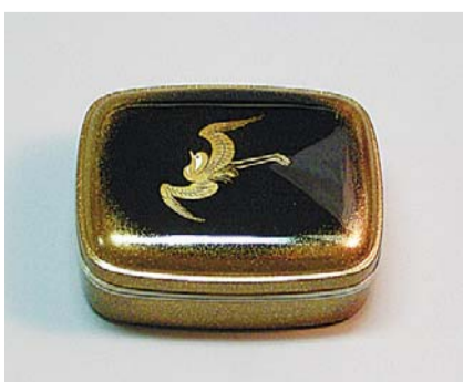
松田権六「千鳥蒔絵香合」

観覧料 一般:300円(200円)、小・中学生:100円(50円) ※カッパ内は、団体20人以上です。 休館日 火曜日(祝日に当たるとき)