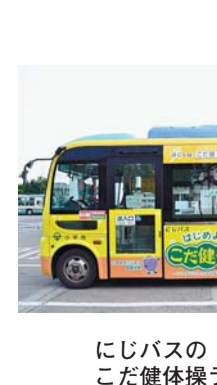
にじバスのこだ健体操ラッピング

こだ健体操は、足・腰の筋力強化と、全身のバランス能力向上を目的に、「新こだいら音頭 スペシャルダンスバージョン」に合わせて行う、小平市のオリジナル体操です。