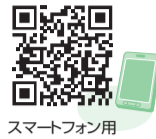
スマートフォン用