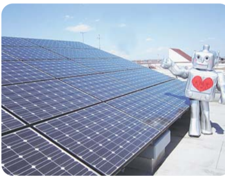
小平市太陽光発電イメージキャラクター ソラミ

環境基本法では6月5日を環境の日と定め、環境省の主唱により6月の1か月間を環境月間としています。今年も夏の安定的な電力供給のために、引き続き節電の取り組みが大切です。夏の1日の電力使用のピークは午後2時ごろです。日常的に無理のない節電を行いながら、特にピーク時間帯に消費電力の大きい電化製品の使用を控えるなど、めりはりをつけたり取り組みを行いましょう。家庭や事業所で、一人一人が少しずつ節電の努力をすることが大きな力となります。