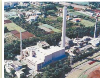
昭和61年11月の4・5号ごみ焼却施設（中央の高い煙突の建物）竣工当時の写真。まだ右側に取り壊し前の1・2号ごみ焼却施設の煙突も建っています。

衛生組合は、昭和40年2月1日に村山町、大和町（現在の武蔵村山市、東大和市）とともに設立され、半世紀にわたって、近隣の皆さんのご理解とご協力をいただきながら、着実にごみの適正処理に取り組んできました。