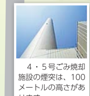
4・5号ごみ焼却施設の煙突は、100メートルの高さがあります。