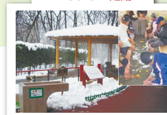
敷地内の井戸からくみ上げた地下水を、焼却の余熱を利用してお湯にしています。玉川上水の緑道に面した雑木林のこもれびの下で楽しめます。