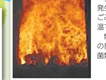
ダイオキシンなどの発生を抑えるために、ごみは850度以上の高温で焼却します。燃やすことで、ごみの臭いは分解され、細菌類などは死滅します。