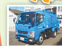
燃えないごみ粗大ごみ 1年で約7,100t 1年で約1,500t