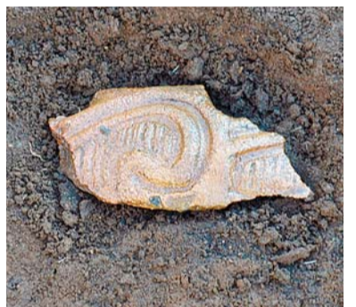
発見された縄文土器片

おととし始まった鈴木遺跡回田町326番地地点の発掘調査では、南側に小支谷(支流)が作った小さな谷が確認され、遺跡のこれまで謎だった部分を解き明かすものとなりました。そして縄文土器や、市内で初めて発見された弥生土器の小片、江戸時代の水田跡などから、くぼみとして残ったこの小支谷が、旧石器時代以降の人々の暮らしにも関わっていたことが確かめられました。