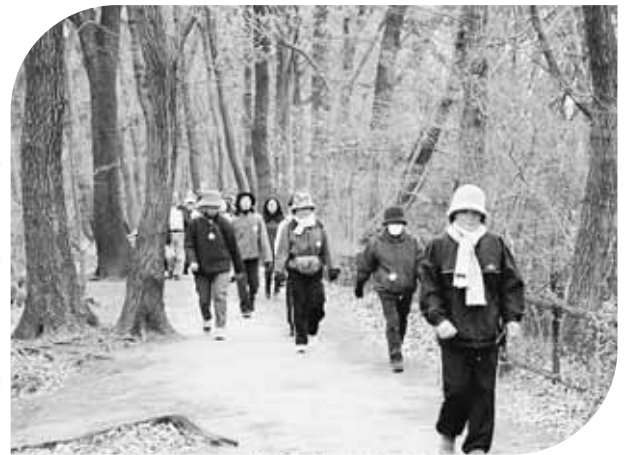
元旦歩け歩けのつどい コース