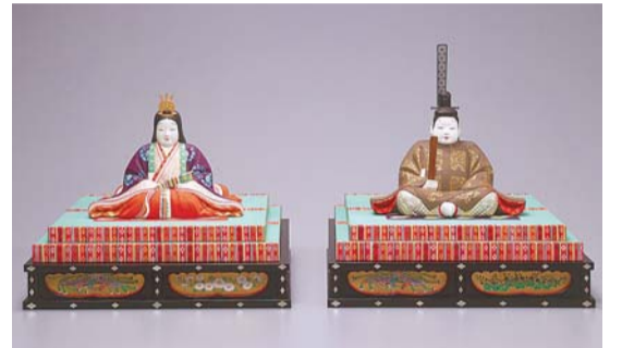
平櫛田中作 内裏びな(昭和10年頃)

とき 5月20日(日)まで 午前10時～午後4時 ※なるべく午後3時30分までに入館してください。