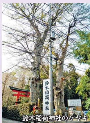
鈴木稻荷神社のケヤキ