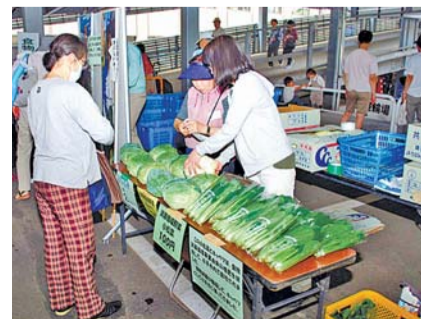
食物資源堆肥使用の小平産資源循環野菜