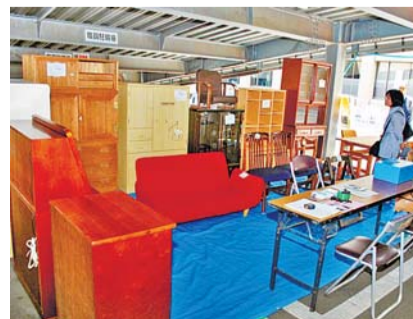
粗大ごみで出された家具類の展示販売