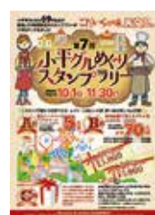
グルメめぐり スタンプ台紙

とき 10月1日(月)~11月30日(金) ところ 市内の飲食店、菓子店など69店舗 主催 小平グルメの会 ※参加店舗など、詳しくはスタンプ台紙または小平市ホームページをご覧ください(スマートフォンからは右図のQRコードを読み取ってアクセス)。 問合せ 産業振興課 ☎042(346)9534