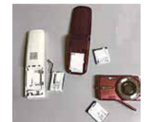
充電式電池を使用している製品の一部(左から電話機の子機、携帯電話、デジタルカメラ)