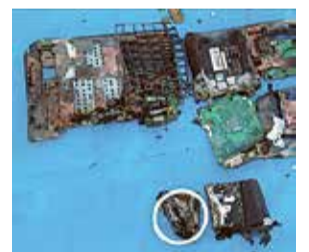
火災の原因となったパソコンのリチウムイオン電池(丸印)

※電池を抜いた小型家電は市役所などの回収ボックスに出してください。回収ボックスの投入口は、たて11センチ×よこ24センチです。投入口に入らないものは燃やさないごみへ。※回収ボックスは市役所、東部・西部市民センター、中央・喜平・上宿・津田・大沼図書館、なかまちテラスに設置しています。