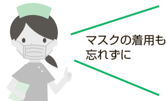
マスクの着用も忘れずに

インフルエンザやノロウイルス予防対策を徹底しましょう。 ▷外出後や食品を扱う前、手のひらでせき、くしゃみを受け止めた時は、石けんと流水で丁寧に手洗いをする。 ▷感染症が流行してきたら、人混みや繁華街への外出を控える。 ▷体の抵抗力を高めるために、十分な休養とバランスのとれた栄養摂取を日ごろから心がける。 ▷具合が悪ければ早めに医療機関を受診する。 ▷おう吐物やふん便の処理をする場合は使い捨てのマスクや手袋を着用する。