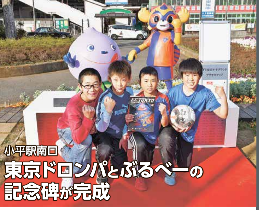
小平駅南口 東京ドロンパとぶるべーの 記念碑が完成

市内に練習グラウンド(小平グラウンド)があるプロサッカーチーム・FC東京のクラブ創設20周年を記念して、最寄り駅の小平駅南口に記念碑(モニュメント)を設置しました。設置にあたり、200万円を目標に寄付を募り、目標額を上回る寄付が集まりました。