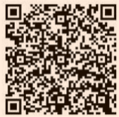
東京電子自治体共同運営サービスのQRコード