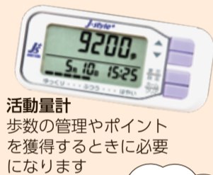
活動量計 歩数の管理やポイントを獲得するときに必要になります