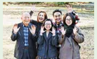
ワークショップに参加した皆さん

こうしたワークショップに参加し、さまざまな世代の方と一緒に話すことができ、世代や住む地域によって生活に求めることが違うなど、今まで知らなかった発見がありました。小平の将来のために大切にしたいことが共有できました。