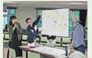
ワークショップでの発表