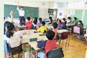
小学校への出前授業

骨子案策定の過程で、無作為抽出で選ばれた方を対象にワークショップを行いました。ワークショップでは小平の特徴は何か、今後どのような課題があるのかを整理し、将来目指したい小平の姿を話し合い、意見をいただきました。ほかにも小学校への出前授業や中学・高校・大学生、外国籍の市民に小平の将来についてのインタビューなどをして小平の魅力や将来像の意見をいただきました。骨子案は、こうした声に基づき作られています。