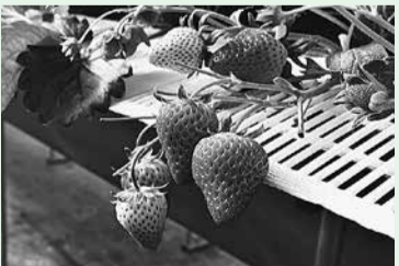
いちごジャム作り体験などができます