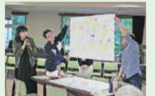
ワークショップでの発表