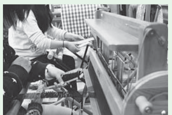
市内の障がい者施設で 手作りしています