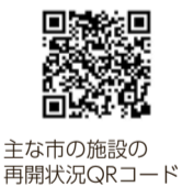
主な市の施設の再開状況QRコード

国における東京都の緊急事態宣言が解除され、休館となっていた市の施設を、状況に応じて準備が整いしだい順次再開します。 なお、各施設の再開の時期は、小平市ホームページで随時お知らせするほか、各施設へお問い合わせください。