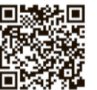
小平市アプリの紹介QRコード