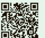
小平市ツイッター、フェイスブックQRコード

小平市ホームページやメールマガジンに防災・防犯緊急情報として掲載した記事、イベント、感染症の流行など市民の健康や生活などに影響を与える可能性がある情報を中心に配信しています。