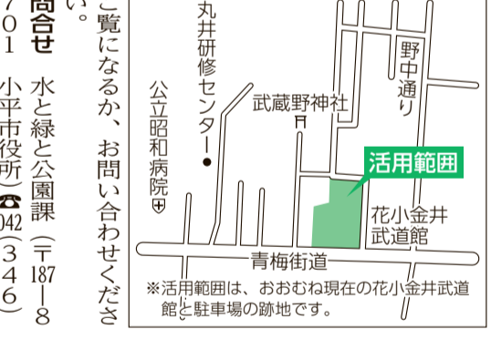
活用範囲は、おおひね現在の花小金井武蔵野社と駐車場の跡地です。

通知を発送 特定健康診査・一般健康診査 生活習慣病の予防・早期発見のため、7月から実施します。対象の方には6月下旬に受診に必要な書類を発送します。