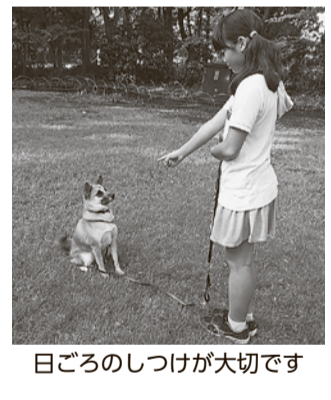
日ごろのしつけが大切

注意報・警報が外へ出る ▽屋外へ出る ▽地盤を揺る ▽目やのどが痛くなったら、すぐに洗眼し、うがいをする