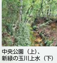
中央公園(上)、新緑の玉川上水(下)