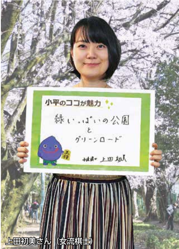
上田初美さん (女流棋士)

高齢者対象 季節性インフルエンザ予防接種……3面 小平市観光まちづくり大使が語る 私たちのまち こだいらの魅力……4・5面 元気村まつりウィーク2020……8面