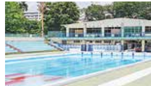
子どものころ、よく行っていた狭山公園プール

小川東町出身。俳優、声優、演出家、脚本家、ダンサーなど幅広く活躍。NHK Eテレ「みいつけた」のオフロスキー役としても知られる。