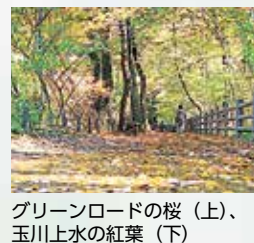
グリーンロードの桜(上)、玉川上水の紅葉(下)