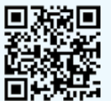
元気村まつりウィーク2020 ホームページ