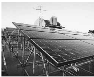
市民共同発電所1号

NPO法人こだいらソーラーは、環境にやさしいエネルギー(再生可能エネルギー)を地域で作成、地域で消費することを目指す活動をしています。活動の一つとして、太陽光発電設備の費用を市民から集め、市内事業者から屋根を借りて、太陽光発電を運営する取り組みがあります。