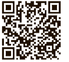
東京都 新型コロナウイルス 感染症支援情報ナビ

新型コロナウイルス感染症の影響でお困りの企業や都民の皆さんが、テーマやキーワードなどから東京都や国の支援情報を探せます。 HP検索 東京都新型コロナウイルス感染症支援情報ナビ