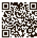
小平市 ホームページ