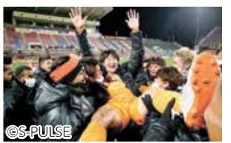
清水エスパルス本拠地 最終戦での引退セレモニー

体を張ったプレーによりけがも多く、現役生活では両ひざを計10回手術しました。「(けがの影響で)毎日練習を休まず全力でプレーしてチームの見本になることと、自分自身が納得するプレーをすることが来年以降の自分には難しいと思った」ことから引退を決断しました。