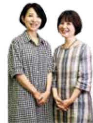
こだはぐの皆さん

このコロナ禍で、女性の家事育児の負担が増えて辛いという声と、逆に夫がリモートワークになり、負担が減っているという声もあり、二極化していると感じています。お互いの負担を減らすという思いやりの気持ちから、困難を乗り越える力が育まれるのではないのでしょうか。