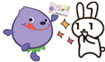
ふるべー マイナちゃん