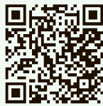
小平市 コロナワクチン 予約システム