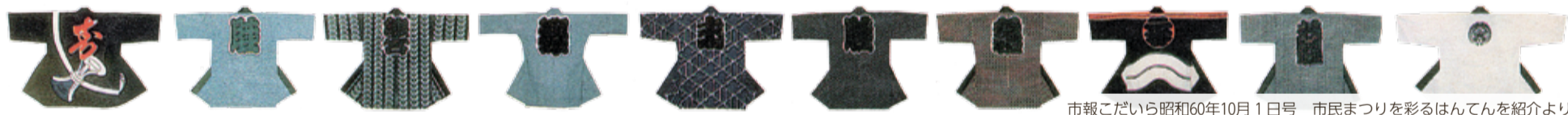
市報こだいら昭和60年10月1日号 市民まつりを彩るはんでんを紹介より