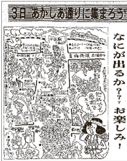
開催を伝える市報 昭和51年10月1日号

小平市民まつりは、毎年10月の第3日曜日に、あかしあ通りの仲町交差点から小平団地西交差点を会場として開催している、市内最大のお祭りです。昭和51年、市民の方々のつながりの強化と新しいふるさとづくりを目的に、市で初めて完成した都市計画道路のあかしあ通り(小平駅南口～学園中央通り間)で第1回小平市民まつりが開催されました。市民まつりの特徴は、来場者が見るだけでなく、一緒に参加して楽しめることです。かつては、社交ダンスやフォークダンスを踊ったり、みこしを一緒に担いだり、カラオケを歌ったりとさまざまな催しが行われていました。また、第1回(昭和51年)から第32回(平成19年)までは、あかしあ通りで民謡流し踊りが披露されていました。