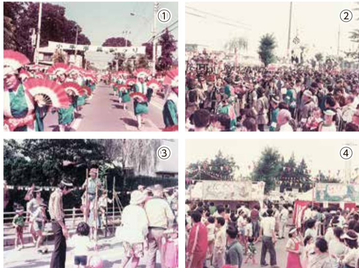
小平市民まつり第1回開催風景 ①民謡流し踊り、②みこし風景、③ちびっこ広場、④催しもの・販売コーナー