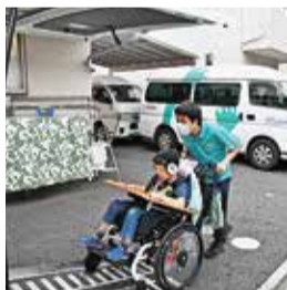
車に乗せるための介助