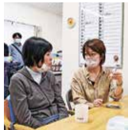
言語訓練をする利用者職員