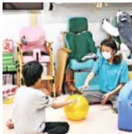
児童とのボール遊び