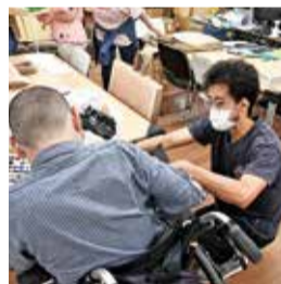
紙袋の製作をサポート