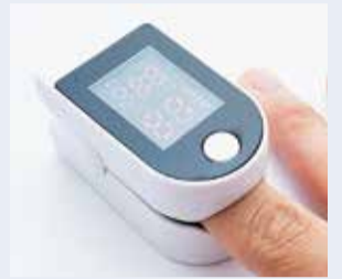
パルスオキシメータ

新型コロナウイルス感染症と診断され、自宅療養している市内在住の方へ、パルスオキシメータ(血中酸素飽和度を測定する装置)を貸し出します。