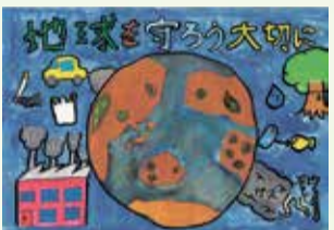
令和3年度環境ポスターコンクール金賞作品

市内の小・中学生によるポスターコンクールの歴代金賞作品を展示します。 とき 5月30日(月)～6月10日(金) 午前8時30分～午後5時 ※6月4日は午前8時30分から正午まで。 ところ 市役所1階ロビー