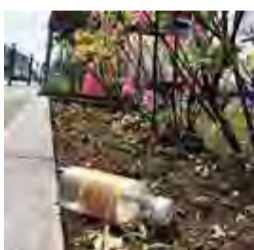
路上脇に捨てられたビン