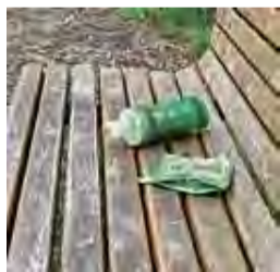
ベンチに捨てられたペットボトルとお菓子の容器包装