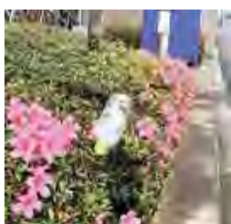
生け垣に捨てられたペットボトル

新型コロナウイルス感染症の影響で、テレワークなど在宅で過ごす時間が増加したり、店舗から灰皿やごみ箱が撤去されたりするなど、住民を取り巻く生活環境が大きく変化しました。それに伴って、市内の駅や路上などにポイ捨てされた缶、瓶、ペットボトルや、たばこの吸い殻などが目立つようになってきました。また、飼い犬のふんが処理されずに放置されていることに関する苦情や相談も多く寄せられています。