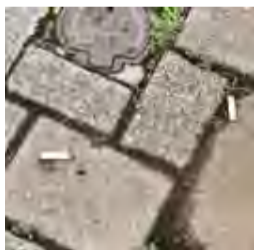
路上に捨てられたたばこの吸い殻