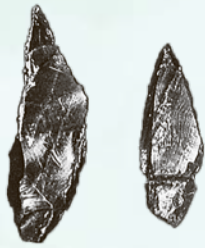
ナイフ形石器(鈴木遺跡)

問合せ 文化スポーツ課(〒187-8701 小平市役所) ☎042(346)9501