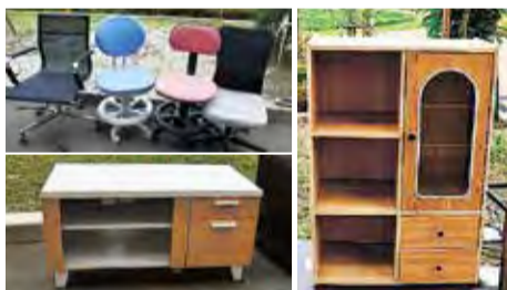
まだ使用できそうなイスや家具