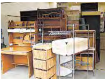
回収された粗大ごみ

これは、新型コロナウイルス感染症の影響で、在宅時間が長くなり、家の片付けをする人が多かったことが大きな原因と考えられます。粗大ごみの中にはまだ使えるものも含まれています。捨てる前に、ほかに使いたい人がいないか、修理して使えないかなど、一度考えてみることで、ごみを減らすきっかけにしませんか。