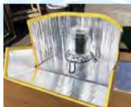
ダンボールソーラークッカー

申込み 7月27日(水)までに、住所、氏名、電話番号、年齢を環境政策課へ(電話・電子メール可、先着順) ☎042(346)9818、✉kankyos eisaku@city.kodaira.lg.jp