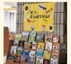
各図書館の展示風景