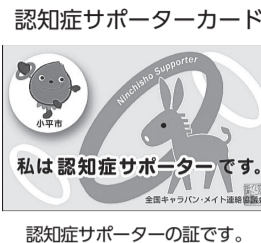
認知症サポーターの証です。