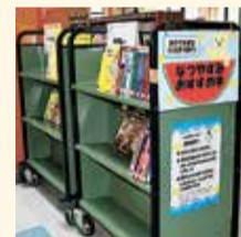
夏休みおすすめ本