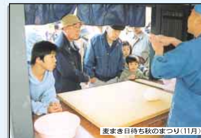
麦まき日待ち秋のまつり(11月)