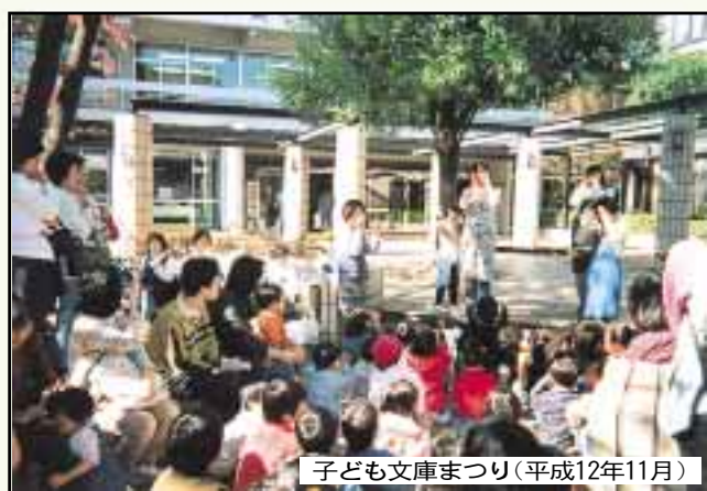
子ども文庫まつり(平成12年11月)