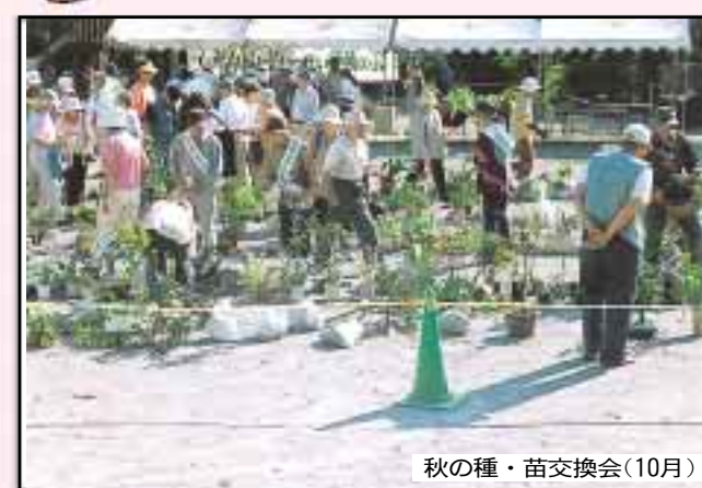
秋の種・苗交換会(10月)

武蔵野手打ちうどん保存普及会では、昨年11月18日(日)、恒例の「麦まき日待ち秋のまつり」を市教育委員会と共催で実施し、約700人の皆さんに手打ちうどん・ゆでまんじゅうなどを試食していただきました。当会はこの伝統の食文化を21世紀に残すため、広く講習会・奉仕活動を行っています。今年設立15周年、多くの皆さんの参加をお待ちしています。