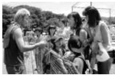
選手とのふれあい(昨年)

FC東京小平グラウンドで、夏休み期間中、練習見学会と各種イベントを実施します。ぜひこの機会にサッカー選手に会いに来ませんか。 とき 8月29日(金)まで FC東京コーチによる サッカークリニック とき 8月30日(土)・31日(日) 全2回 ▽指導者コース：午前10時〜正午