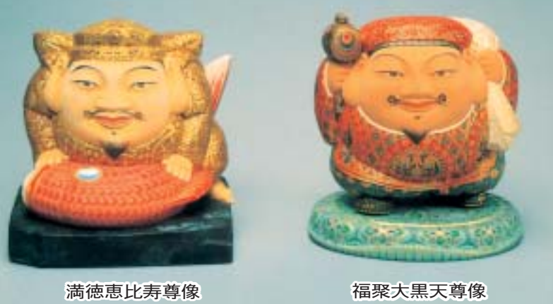
満徳恵比寿尊像 福聚大黒天尊像

お正月にあわさわしい、大黒、恵比寿などおめでたい作品を展示します。 と き 1月7日（水）～2月8日（日）