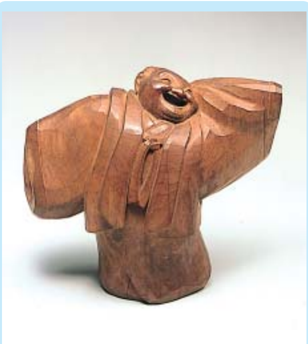
きらくくぼう 木彫 昭和36年 指人形がモデルです。田中が晩年、好んで制作したテーマで、田中館で最も人気のある作品です。

日本を代表する彫刻家、平櫛田中は晩年の10年を玉川上水の緑豊かな小平の地で過ごしました。その館が小平市平櫛田中館として開館して今年で20周年になります。静かなたたずまいの中で田中の生前の生活を思いやり、田中芸術の神髄を味わってみませんか。