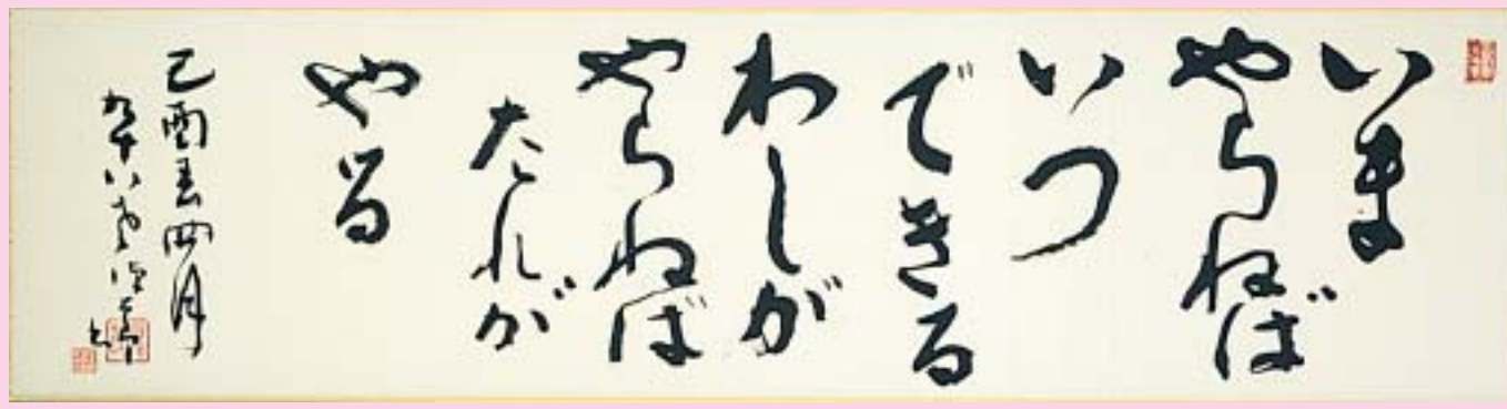
いまやらねば 書 昭和44年 生涯現役はこの気概があったから。晩年に趣味で書いた書の評価も高く、たくさんの愛好家があります。