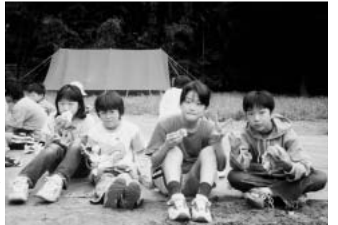
ジュニアリーダー養成講座 日程