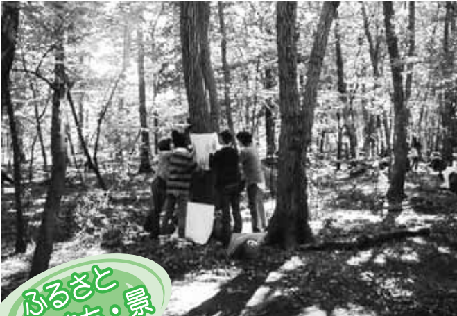
ふるさと 人・まち・景