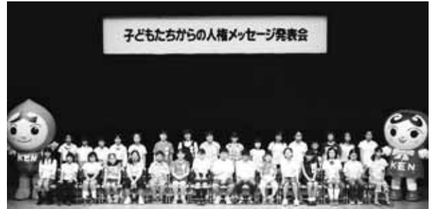
子どもたちからの人権メッセージ発表会