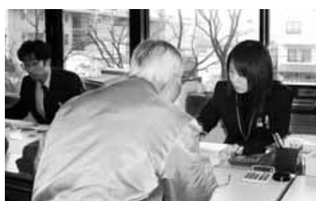
市役所税務課で申告している様子

▽平成17年1月1日現在、市内に住所はないが、市内に事務所、事業所または家屋敷がある方